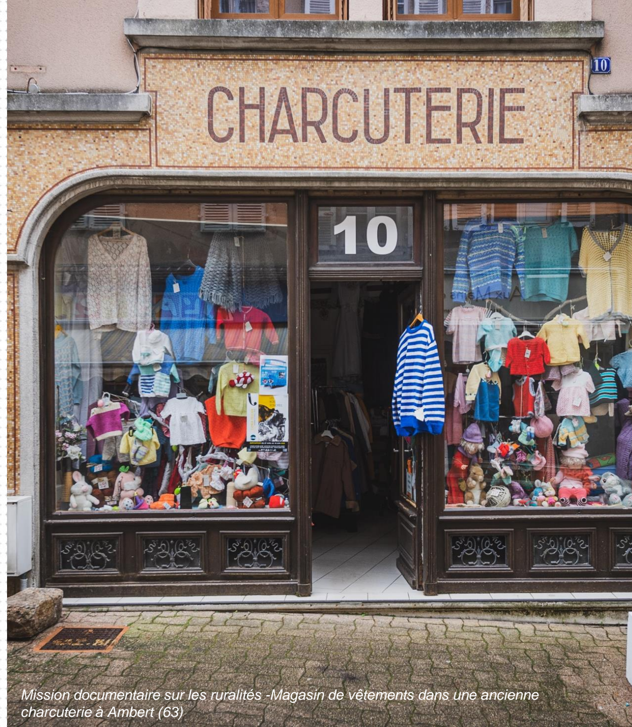
Mission documentaire sur les ruralités -Magasin de vêtements dans une ancienne charcuterie à Ambert (63)